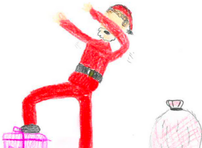
Tegnet av Thea 4a