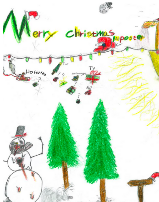
Tegnet av Luka 4a