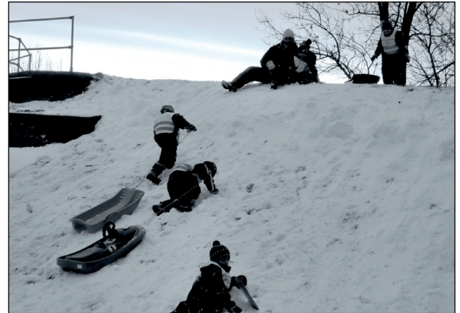
Maalin xiliga barafka daajoah

Maalintan waxa loogu talo galay in dibedda iyo barafka lagu ciyaaro. Bannaanka oo loo baxo iyo dibedda oo lagu ciyaaro waxay qeyb ka tahay dhaqanka Norweyjiga, iyo waxyaalaha qiimaha leh ee aanu doonayno in la barto. Waxaanu rabnaa in dibadda oo lagu ciyaaraa ay noqoto wax lagu farxo.