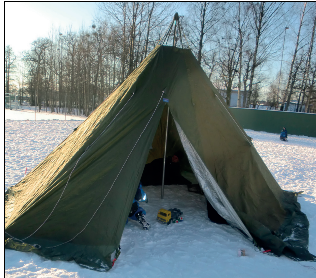
Maalinta qowmiyada saamaha

Maalinta qaranimada Saammuhu ma da'weyna, waxana maalintan lagu go'aamiyey shirkii Saammaha ee 1992. Maalintani waxay ka dhaxaysaa qowmiyadda Saammaha oo dhan Norway, Finland, Sweden iyo Ruushka, waana maalin calanka laga saaro Norway. Dugsiyada xannaanada carruurta iyo Iskuulada Norway waxa badanaa laga sameeyaa mashaariic ama mowduucyo ku taxaluqa qowmiyadda Saammaha kuwaas oo lagu beego xilliyada ku dhow-dhow maalinta qaranimada Saamaha, waxa beryahan dambe caadi noqonaysa in la xuso maalinta qaranimada Saammaha lafteeda.