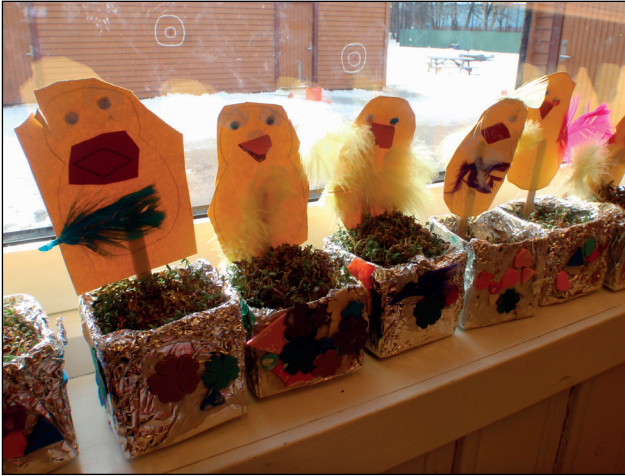
Xilli diimeedka easter-ka

Nuxurka diimeed ee ku jira Easter-ku waa in Nebi-Ciise ku geeriyooday alwaaxii iskutlaabta ahaa ee lagu dhidbay, laakiin uu ka sare kacay markii dambe. Arrintan aad loogama warramo marka la joogo dugsiga xannanada carruurta, laakiin Kiniisaddu waxay fidsaa martigaad arrintan la xiriira oo lagu magacaabo socodka Easter-ka (eeg mowduuca hoose «påskevandring»). Dugsiga xannaanada carruurta marka la joogo waxaanu xooga saarnaa ka hadalka xilliga gu'ga iyo nolosha cusub ee la dhalata. Waxaanu samaynaa waxyaalo sharraxaad iyo qurxin ah, annaga oo isticmaalayna midabada Easter-ka ee hurdiga (jaalle) iyo cagaarka, tusaale ahaan ukunta Easter-ka. Carruurta qaarkood wax bay irbad ku tolaan qaar kalena waxay soo gurtaan geedaha yar-yar ee iniinyaha cusub leh.