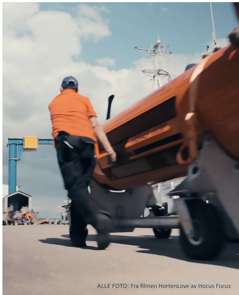
ALLE FOTO: Fra filmen HortenLove av Hocus Focus