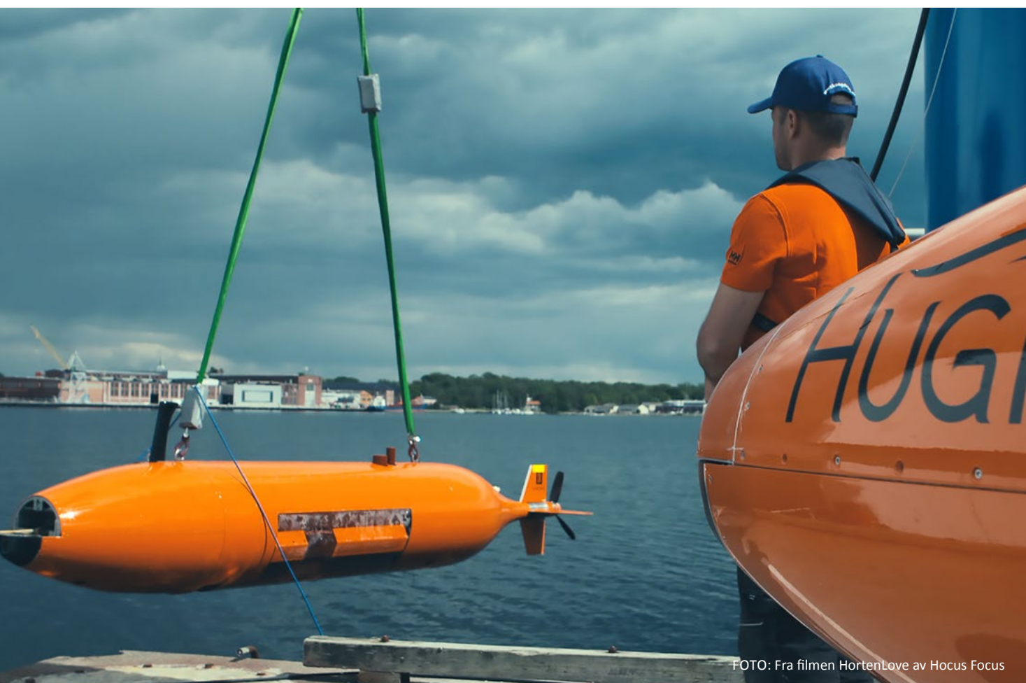
FOTO: Fra filmen HortenLove av Hocus Focus