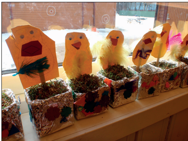
Spire og gro til Påske

Det kristne budskapet i påsken handler om at Jesus døde på korset, men sto opp igjen. Dette tas ikke spesielt opp i barnehagen, men kirken inviterer til påskevandring (se avsnitt om påskevandring). I barnehagen fokuserer vi mest på våren og det nye livet. Vi lager litt påskepynt i påskefargene gult og grønt, som for eksempel påskekyllinger. Noen sår karse eller andre frø som de ser spire.