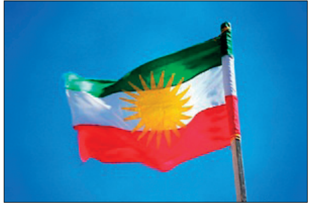
Newroz / Nouroz

Dette er kurdernes nyttårsdag der de hilser våren velkommen. Newroz blir feiret av befolkningen i Iran, Aserbajdsjan, Afghanistan, Kaukasus, Tadsjikistan, Kurdistan, nord- India og også av bahá'ier. Feiringen har sine røtter flere tusen år tilbake og er skrevet inn på UNESCOs liste over Mesterverker.