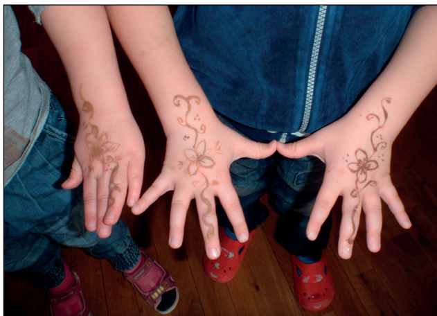
Eid al fitr og id ul-adha

I barnehagen har vi en markering i etterkant av Id