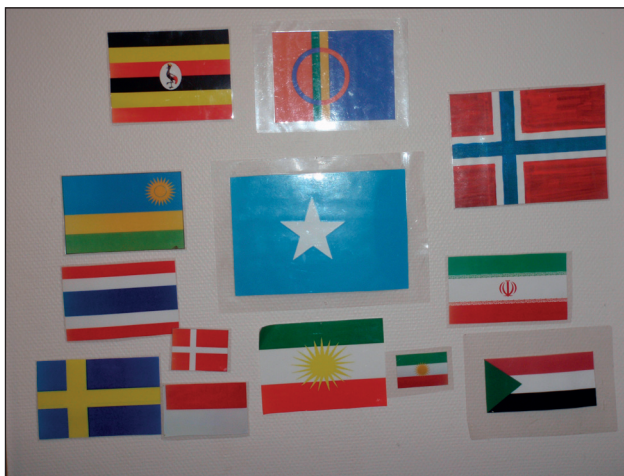
FN - dagen

FN ble offisielt etablert 24. oktober 1945, for å stoppe krig og danne en plattform for dialog. Det er i dag 193 medlemsland i organisasjonen. Organisasjonens mål er å arbeide for internasjonal fred og sikkerhet og å utvikle vennskapelige relasjoner (wikipedia).