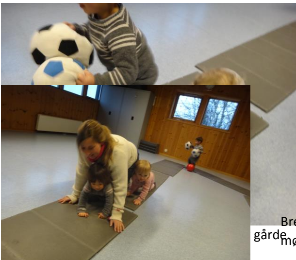
Brekende sauer som møtte. gårde

Man skal gjøre de samme bevegelsene som dyrene gjør, den voksne viser først. Man kan også gå etter hverandre slik at barna ser på den foran og kan herme etter.